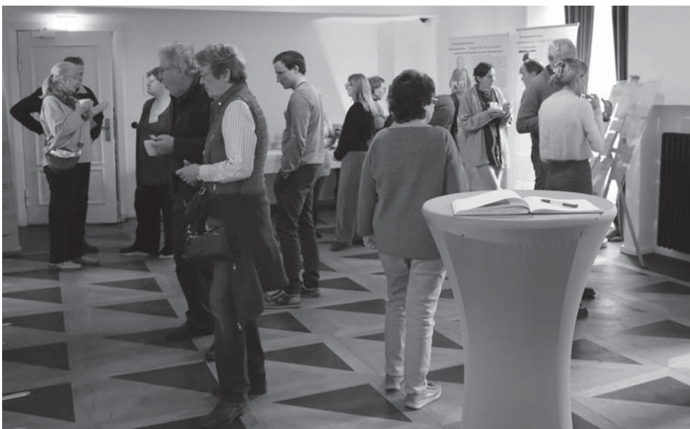
Tagungsgäste bei der Besichtigung der Ausstellung.