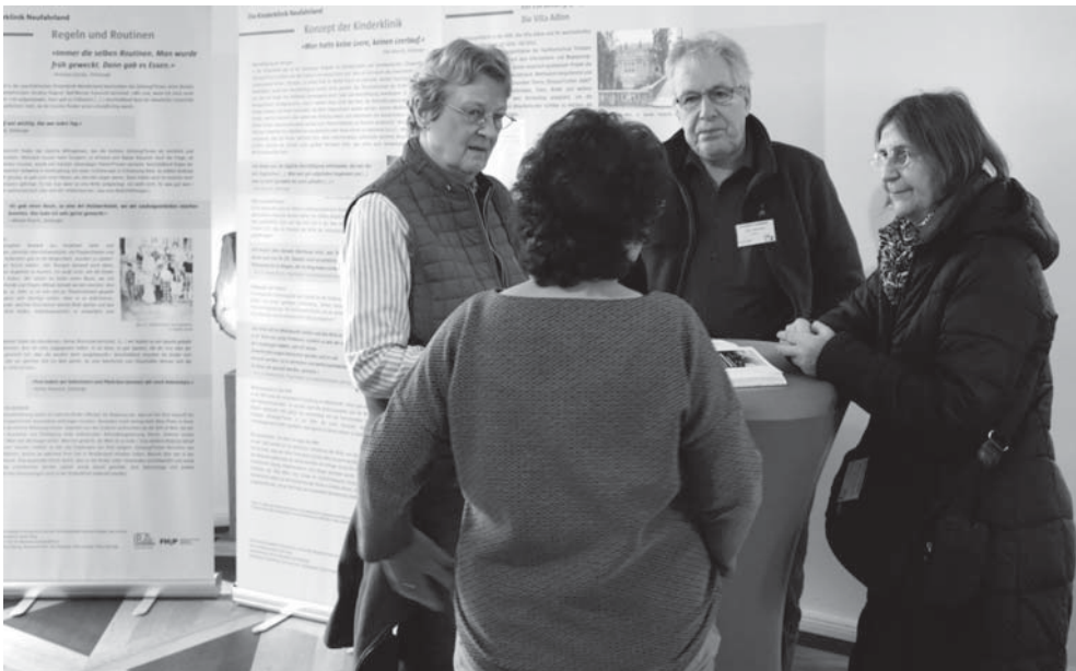
Tagungsgäste und Mitwirkende des Reallabors der FH Potsdam und Zeitzeugen im Gespräch am historischen Ort.